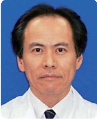
西美濃厚生病院 病院長