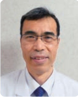
西美濃厚生病院 病院長