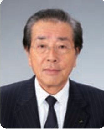
岐阜県厚生農業協同組合連合会 経営管理委員会会長