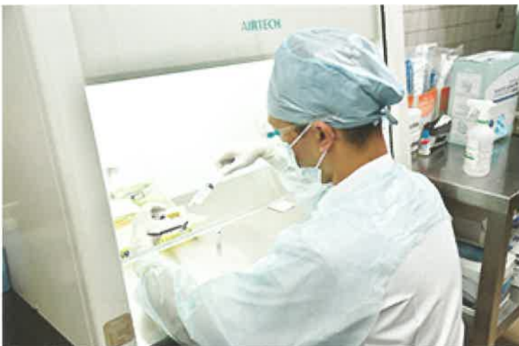
注射薬の調剤や高カロリー輸液の混注

務実習生を積極的に受入れ、薬学教育も行っています。さらに、特定の疾患に対する薬物療法などについては、専門知識を身につけた薬剤師が求められます。そこで、薬の知識と実務スキルが豊富な「認定薬剤師」という資格を取得し、良質かつ安全な薬物療法を行うために活躍しています。これからも医療の質の向上・医療安全の確保を基本方針として業務に取り組み、患者様へのサービス向上に努めていきます。