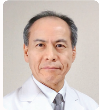
西美濃厚生病院 病院長