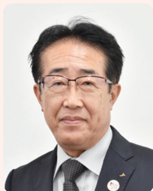
岐阜県厚生農業協同組合連合会 経営管理委員会会長