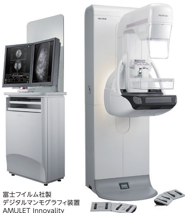
富士フイルム社製 デジタルマンモグラフィ装置 AMULET Innovality

当院は検診精度管理の線量・画質基準を満たすマンモグラフィ検診施設としての認定を取得し、マンモグラフィ撮影認定技師により撮影を行っております。健診センターと外科外来にて運用を行っておりますので安心して検査にお越しく下さい。