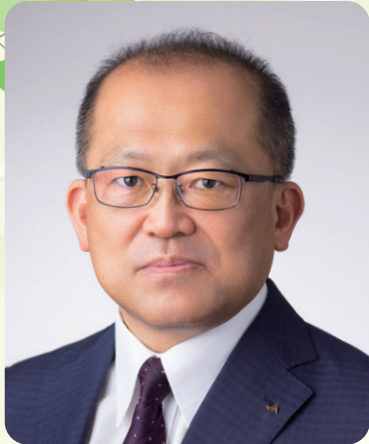
岐阜県厚生農業協同組合連合会 代表理事理事長